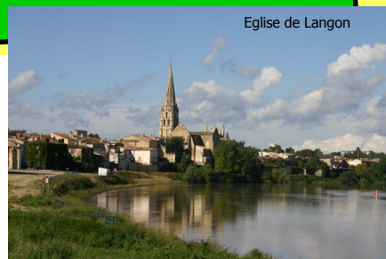
Eglise de Langon

Le magazine de la Communauté Catholique des secteurs de Langon et Podensac