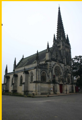
Eglise de Podensac